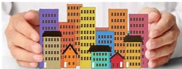
Comunidad de Propietarios