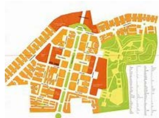
Entidad de Conservación