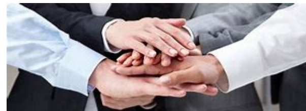
Asociación de Empresarios